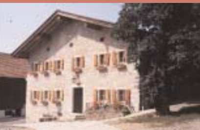
Noch heute zeugen manche Gebäude von dem einstigen Treiben auf dem goldenen Steig, wie hier die denkmalgeschützte Säumerherberge in Fürholz, Gemeinde Grainet.

Lange vor Christi Geburt pflegten schon die Kulturen der Jungsteinzeit und danach die Kelten Verbindungen durch den noch dicht geschlossenen Böhmerwald. Einer der ältesten Handelswege führte schon vor 1200 von Passau nach Böhmen. Im 14. Jahrhundert kamen weitere Routen hinzu.