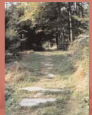
Die Instandhaltung und Passierbarkeit der Wege bei jedem Wetter hatte im Abteiland eine besondere Priorität. Von der Wichtigkeit dieser Wege gibt es noch heute Zeugnisse im Gelände, wie hier das mit Natursteinplatten befestigte Originalstück des "Goldenen Steiges" bei Geysberg.