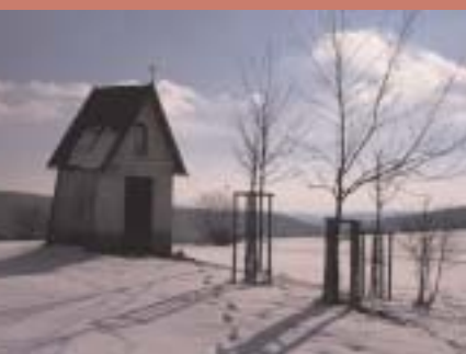
Die Kreuzkapelle südlich von Kreuzberg. Es ist denkbar, dass an dieser Stelle ein Kreuz aufgestellt war, das für den landschaftlich markanten Berg und schließlich auch für die Ansiedlung Namensgeber war.

wurde Kreuzberg so für lange Zeit der bedeutendste Wallfahrtsort des Bistums Passau. Auch heute finden noch Wallfahrten zur Hl. Anna statt.