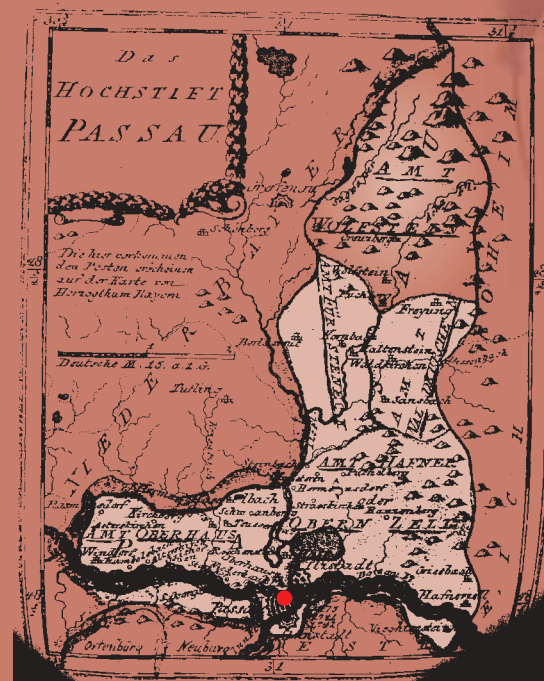
Karte um 1800 □ Gebiet der Freyung ● Kloster Niedernburg

Schloß Wolfstein, 1577 bis 1590 zur heutigen Gestalt umgebaut, war im 17. und 18. Jahrhundert beliebtes Jagdschloß der Passauer Fürstbischöfe und wurde kunstvoll ausgestattet. Im Bild vorne die frühere "Mittermühle". Heute ist das Schloß Sitz des Landratsamtes, beherbergt das Jagd- und Fischereimuseum sowie das Kreisarchiv.