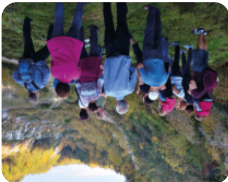
Führung am Steinbruch

Am „Erlebnislehrpfad Kulturlandschaft“ säumen heckenreiche Streuobstwiesen, Weiher, Bachwiesen und knorrige Hangwälder den Weg. Ein Lehrbienenstand im Obstgarten und der Beobachtungsstand an den Wehnen bieten vielfältige Möglichkeiten der Naturinformation und Naherholung.